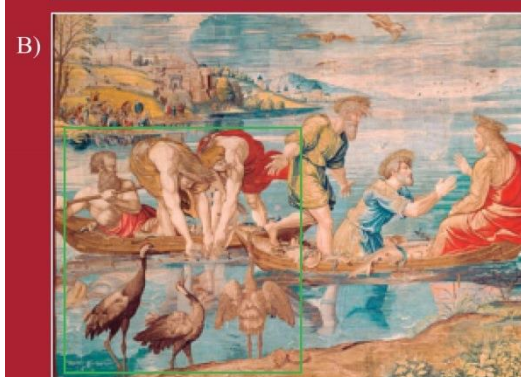
Pesca miracolosa. - Arazzo Pinacoteca Vaticana